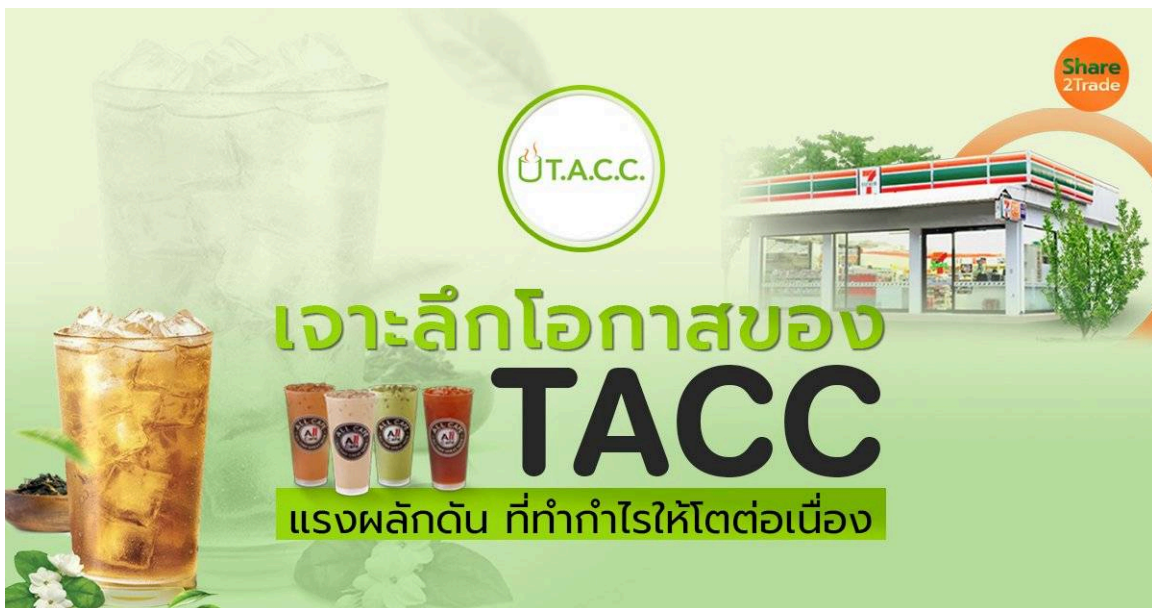
เจาะลึกโอกาสของ TACC_S2T (เว็บ) copy_0.jpg

เกาะติดแนวโน้มการเติบโตของ บริษัท ที.เอ.ซี.คอนซูเมอร์ จำกัด (มหาชน) หรือ TACC ผู้ประกอบธุรกิจจัดหา ผลิต และจำหน่ายเครื่องดื่มประเภทชาและกาแฟ และสินค้าไลฟ์สไตล์ โดยแบ่งกลุ่มผลิตภัณฑ์ของบริษัทได้ 2 กลุ่ม ดังนี้