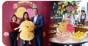
TACC ร่วมงาน Warbie’s Whimsical Holiday