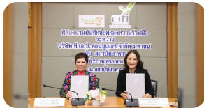
TACC จับมือ “NFI” ยกระดับอุตสาหกรรมอาหารครบวงจร ปีที่ 2

ปัจจุบัน TACC ยังคงเดินหน้านโยบายการสร้างการแข่งขันแกร่งให้ธุรกิจหลักเพื่อสร้างการเติบโตอย่างมั่นคงและยั่งยืน ให้ความสำคัญในด้านการพัฒนาเครื่องดื่มรสชาติใหม่ออกสู่ตลาดร่วมกับพันธมิตรหลักทางธุรกิจทั้งในประเทศและต่างประเทศ เพื่อช่วยผลักดันยอดขายเพิ่มขึ้น และรองรับความต้องการของผู้บริโภค รวมถึงบริหารจัดการต้นทุนให้เกิดประสิทธิภาพสูงสุดทั้งทางตรงและทางอ้อม