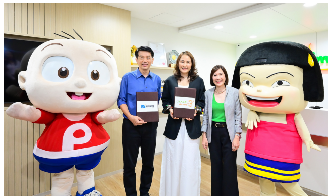
นาง.ท.เ.เอ. ซี.คอนซูเมอร์ หรือ TACC คว่ำลิขสิทธิ์ตัวละครการ์ตูน “ปังปอนด์ – หนูหิ้น – รามเกียรติ์” จาก ม. Vithita Animation ต่อมอดธุรกิจคาแรคเตอร์ ฟากมอสใหญ่ “ซีซีวี วัฒนสุข” ฝ่าใจจุดเด่นคาแรคเตอร์ไทยสุดคลาสสิก ช่วยดึงอุตสาหกรรมไทยได้อย่างแน่นอน ทั้งยังสอดคล้องนโยบาย Soft Power และสนับสนุนภาคเอกชนไทย หวังกระตุ้นยอดขาย ผลิตภัณฑ์รายได้ปีนี้เติบโตเข้าเป้าระดับ 10%