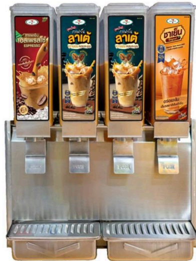
โฆษณา - อำนวยความสะดวกด้านล่าง

ช่วยผลักดันยอดขายเพิ่ม รวมไปถึงการขยายฐานลูกค้าใหม่ทั้งในส่วนของ B2B และ B2C เพื่อรองรับความต้องการของผู้บริโภค รวมทั้งการเพิ่มประสิทธิภาพในการบริหารจัดการต้นทุนทั้งทางตรงและทางอ้อม