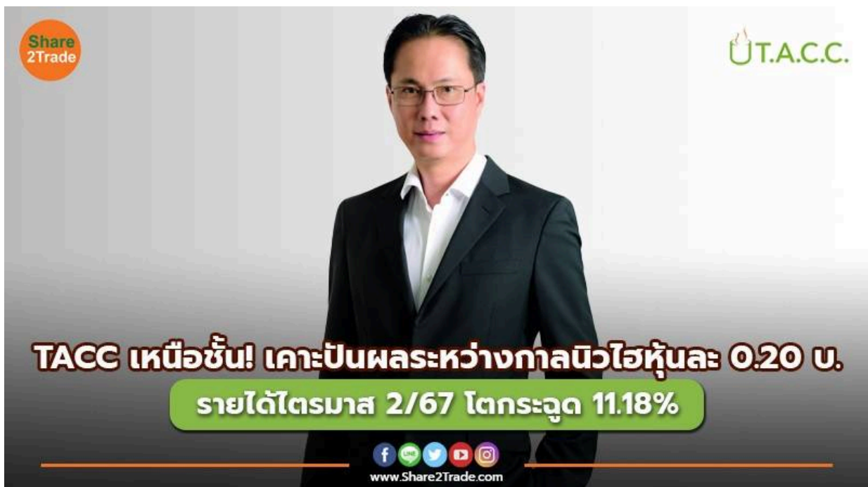
ข่าวลูกค้า TACC เหนือชั้น! เคาะปันผลระหว่างกา.jpg

บมจ.ที.เอ.ซี.คอนซูเมอร์ (TACC) เหนือชั้น! เปิดผลงาน Q2/67 กวาดรายได้รวม 497.23 ล้านบาท เพิ่มขึ้น 11.18% เทียบงวดเดียวกันปีก่อน รับอานิสงส์ท่องเที่ยวหนุน-อากาศร้อนที่เป็นฤดูกาลของการขายเครื่องดื่ม ผลตอบรับดีเกินคาด ดันยอดขายพุ่ง บอร์ดใจดี สั่งจ่ายเงินปันผลระหว่างกาลนิวไฮหุ้นละ 0.20 บาท เตรียมรับทรัพย์ 6 กันยายน นี้ ฟากบีบีเอส “ชัชชวี วัฒนสุข” เดินหน้ารุกตลาดครึ่งปีหลังเต็มพิกัด มุ่งเน้นการบริหารจัดการต้นทุนและการดำเนินงานให้เกิดประสิทธิภาพสูงสุดทั้งทางตรงและทางอ้อม