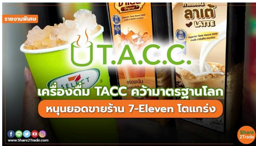
รายงานพิเศษ เครื่องดื่ม TACC คว้ามาตรฐานโลก.jpg

ผลิตภัณฑ์เครื่องดื่มเย็นของ บมจ.ที.เอ.ซี. คอนซูเมอร์ หรือ TACC คว้ารางวัล Superior Taste Award 2024 สะท้อนเครื่องดื่มเย็นในโถกของร้าน 7-Eleven รสชาติโดดเด่น คุณภาพมาตรฐานระดับสากล หนุนการเติบโตของยอดขายในร้าน 7-Eleven