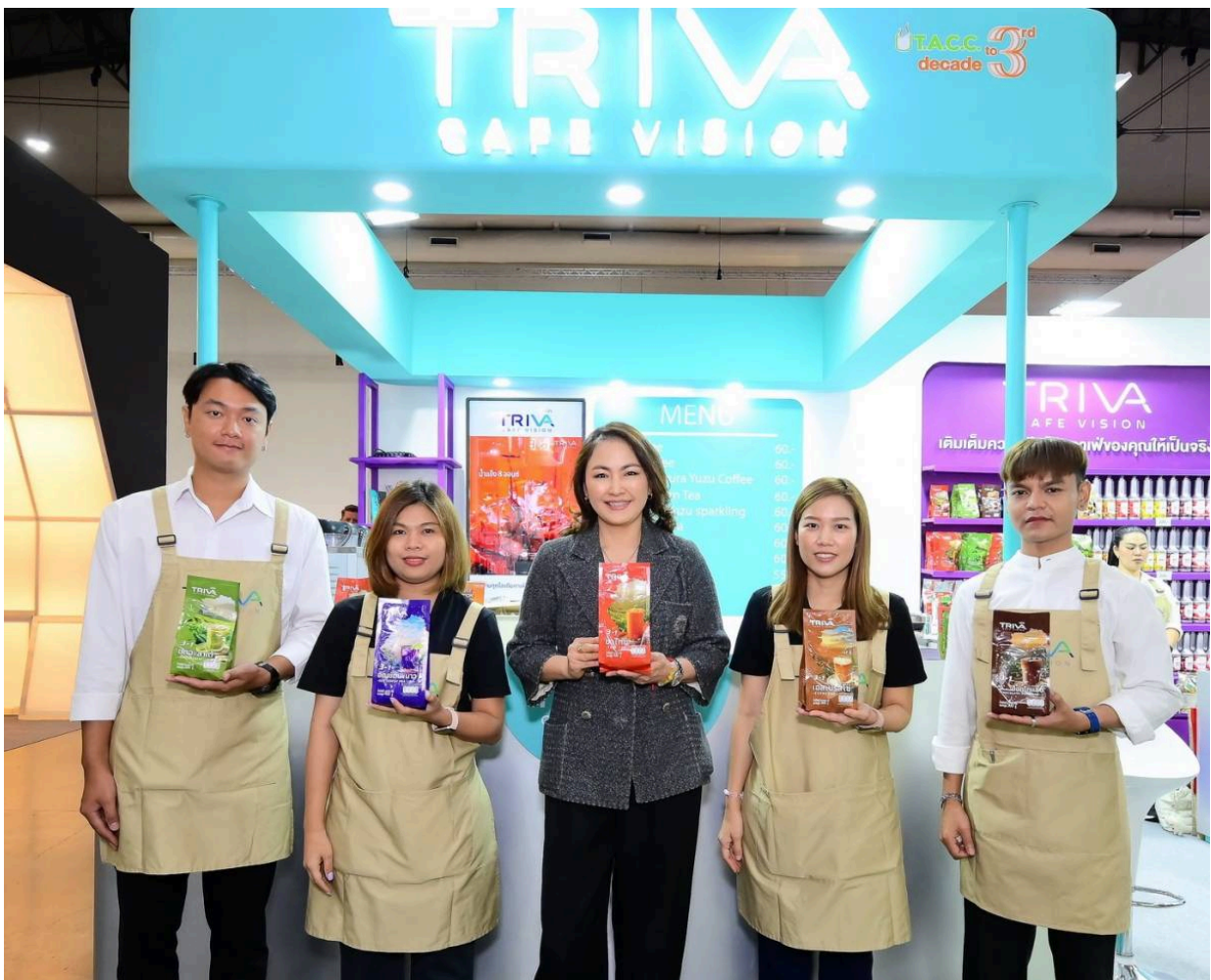
โฆษณา - อ่านบทความด้านล่าง