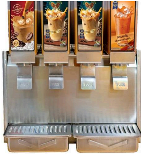
โฆษณา - อ่านบทความต่อด้านล่าง

ประธานกรรมการบริหาร TACC กล่าวอีกว่า มั่นใจว่าแนวโน้มผลการดำเนินงานในปี 2567 จะเป็นไปตามแผนงานที่วางไว้ โดยตั้งเป้ารายได้เติบโต 10% เทียบปีที่ผ่านมาที่มีรายได้รวม 1,727 ล้านบาท และในปีนี้จะถือเป็น "ปีแห่งการสร้างฐานของ New Growth" จากการเปิดตัวสินค้าใหม่ในกลุ่ม Health and Wellness ผ่านบริษัท เฮลท์ อินสไปร์ด แพลนเน็ต จำกัด (HIP) ซึ่งเป็นบริษัทย่อย โดยมีแบรนด์ Bloss Natura ผลิตภัณฑ์เพื่อสุขภาพความงาม และอาหารเสริมชั้นนำที่ผลิตจากประเทศเกาหลี ซึ่งคาดว่าจะในปีนี้จะเริ่มมีทิศทางที่ดีขึ้น และช่วยผลักดันผลการดำเนินงานของบริษัทฯเติบโตอย่างแข็งแกร่งและยั่งยืน สร้างผลตอบแทนที่ดีให้กับผู้ถือหุ้น