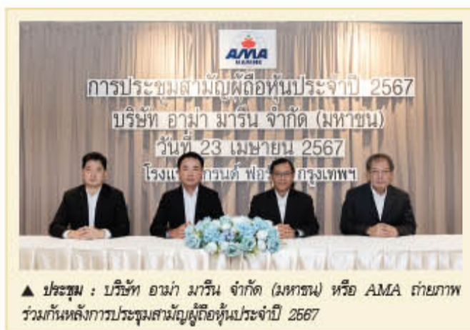
▲ ประชุม : บริษัท อามา มาร์ิน จำกัด (มหาชน) หรือ AMA ถ่ายภาพร่วมกันหลังการประชุมสามัญผู้ถือหุ้นประจำปี 2567

#FSMART #ทันหูน - FSMART “ตู้เต้าปิ่น” เข้าไฮซีจีน น้ำร้อนยาว หนุนยอดเครื่องดีมีขายดี เร่งติดตั้งตู้แต่ละหมื่นตู้ จากปัจจุบันอยู่ที่ราว 6 พันตู้ พร้อมเดินหน้าอัดแคมเปญกระตุ้นยอดซื้อ ด้านผู้บริหาร ส่งสัญญาณธุรกิจการเงินครบวงจรฉายแววเด่น ตั้งเป้าปล่อยสินเชื่อเพิ่ม 500 ล้านบาท