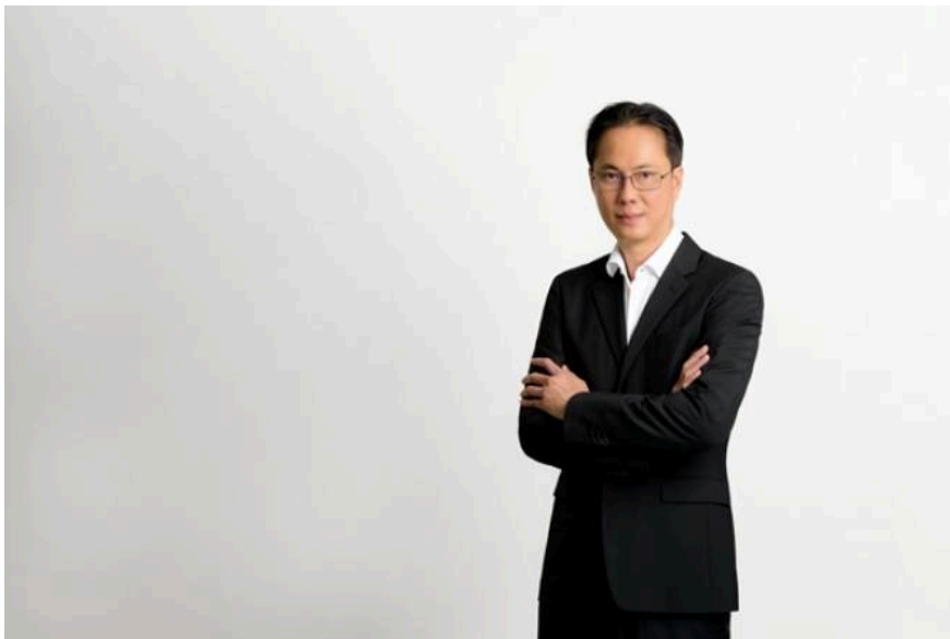
ผู้ถือหุ้น TACC ยกมือหนุนจ่ายปันผลงวดปี 66 ในอัตรา 0.19 บ./หุ้น ขึ้น XD วันที่ 7 พ.ค. - เตรียมรับทรัพย์ 20 พ.ค.นี้

ถูกใจ มีคนถูกใจ 1.5 แสน คน สมัครใช้งาน เพื่อดูสิ่งที่น่าสนใจของคุณถูกใจ