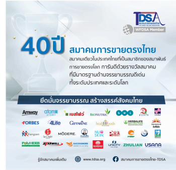
( http://www.tdsa.org/ )