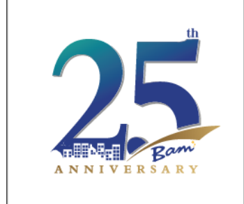
( https://www.bam.co.th/ )