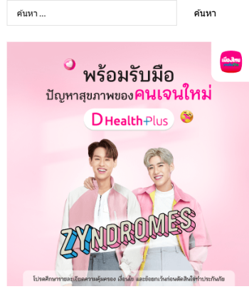
( https://webmtl.co/3K9inPb )