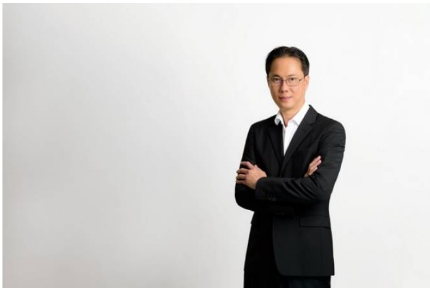
TACC พร้อมเสิร์ฟ “ชาพีช วิตามินซีสูง” ในร้านเซเว่นฯ 28 ก.ย.นี้