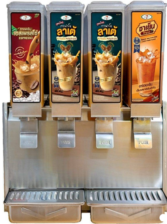
โฆษณา - อ่างบพความค่อค่านล่าง

นายชัยชรี กลาวถึงธุรกิจ TACC ว่าถือเป็นพันธมิตรหลักทางธุรกิจ (Key Strategic Partner) เพื่อผลิตและวางจำหน่ายผลิตภัณฑ์ในร้านค้าสะดวกซื้อชั้นนำของประเทศอย่าง 7-Eleven เข้าร่วมพัฒนาธุรกิจผลิตเครื่องดื่มในโถกดจำหน่ายมาตั้งแต่ปี 2545 ผลิตภัณฑ์แรกๆ คือเครื่องดื่มแบบไทยๆ เช่น ชาเย็น ชานม และกาแฟเย็น ซึ่งประสบความสำเร็จจนทำให้ออดขายเติบโตเกินกว่าห้าตัวในปีแรกๆ จากนั้นจึงพัฒนาตลาดเครื่องดื่ม พร้อมดื่มในโถกดหลากหลายรสชาติ ซึ่งได้รับความนิยมอย่างสูง