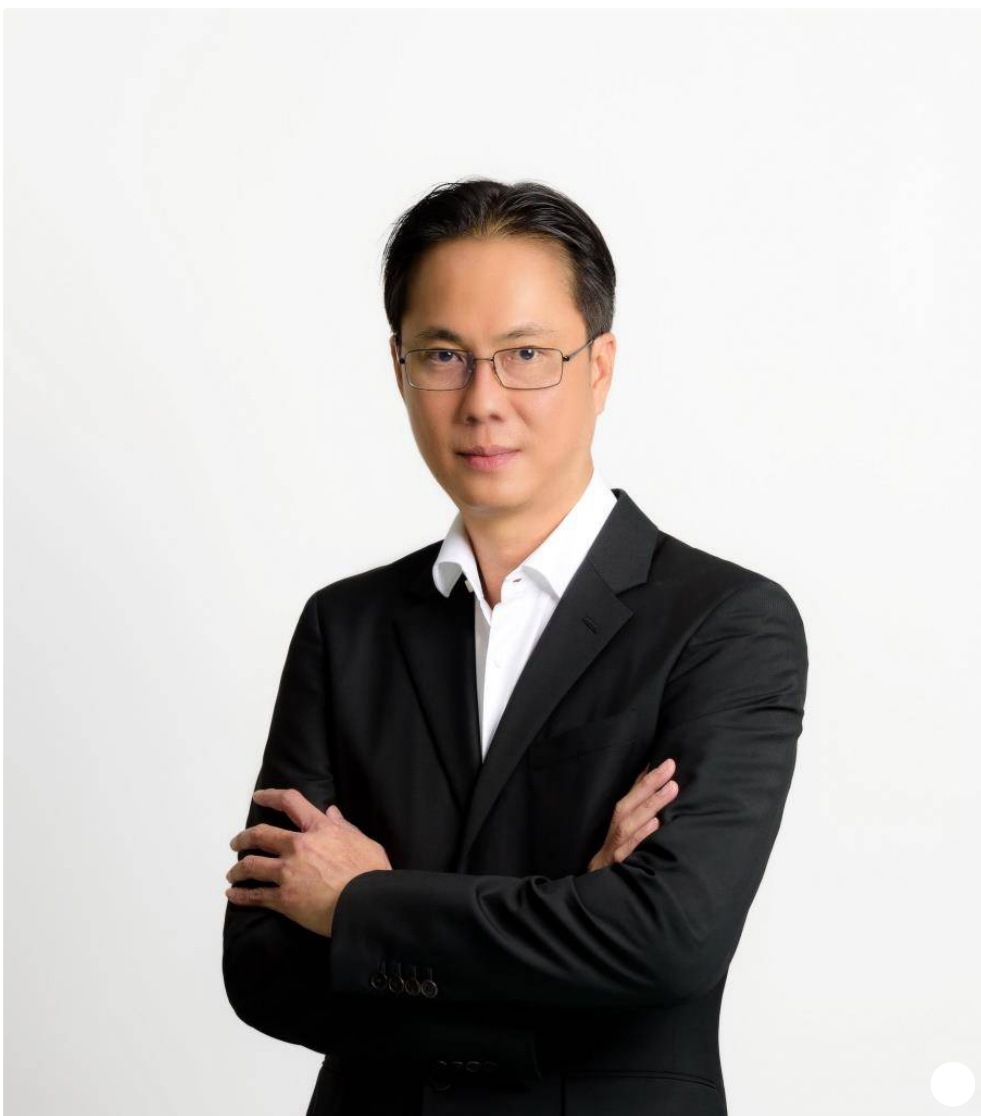
โฆษณา - อ่านบทความด้านล่าง