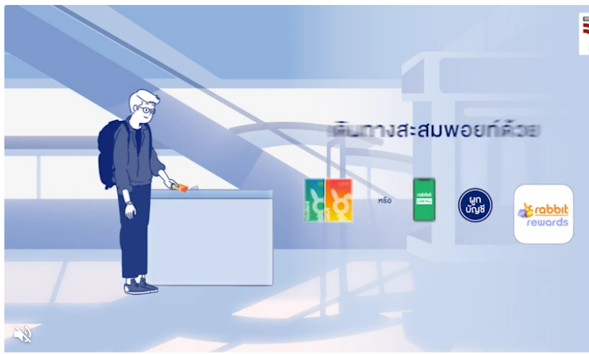
เรียนรู้เพิ่มเติม