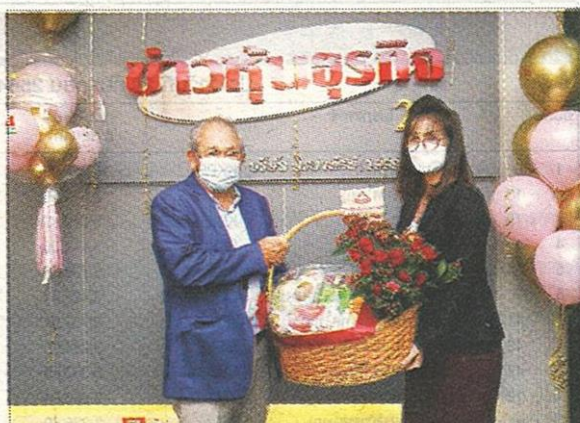
บริษัท สยามราชธานี จำกัด (มหาชน) หรือ SO