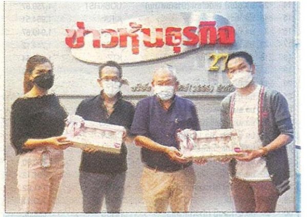
บริษัท เมืองไทยประกันชีวิต จำกัด (มหาชน)