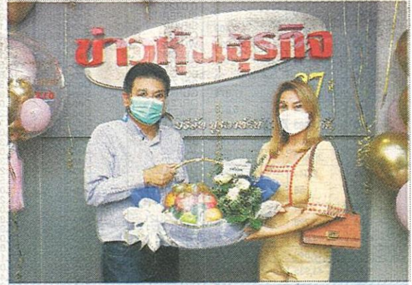
บริษัท โอเชียน คอมเมิร์ซ จำกัด (มหาชน) หรือ OCEAN