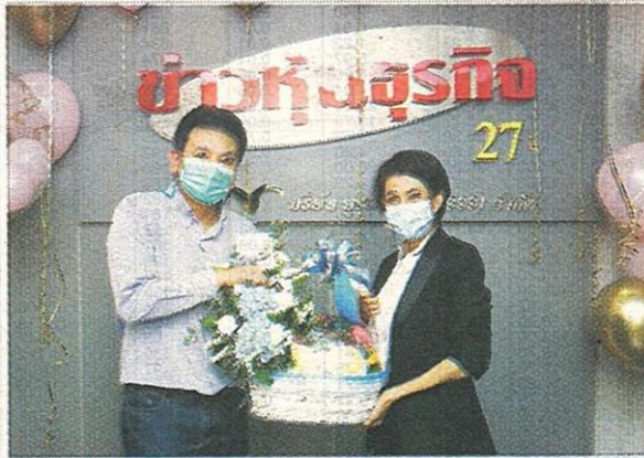
บริษัท บิสซิเนสโกลด์เม้นท์ จำกัด (มหาชน) หรือ BIZ

หัวข้อข่าว: ร่วมแสดงความยินดีข่าวหุ้นธุรกิจ ก้าวสู่ปีที่ 28