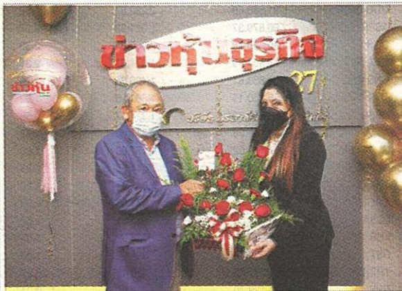
บริษัท ไอรา แคปิตอล จำกัด (มหาชน) หรือ AIRA