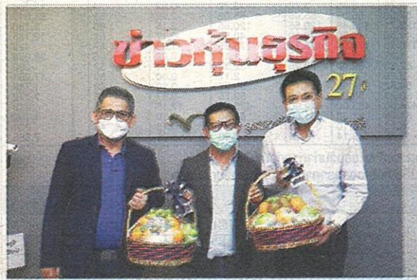
บริษัท ทีเอ็ม คอนซัลติ้ง เอ็นจิเนียริ่ง แอนด์ แมเนจเม้นท์ จำกัด (มหาชน) หรือ TEAMG