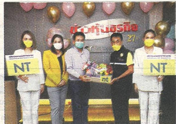
บริษัท โทรคมนาคมแห่งชาติ จำกัด (มหาชน) หรือ NT