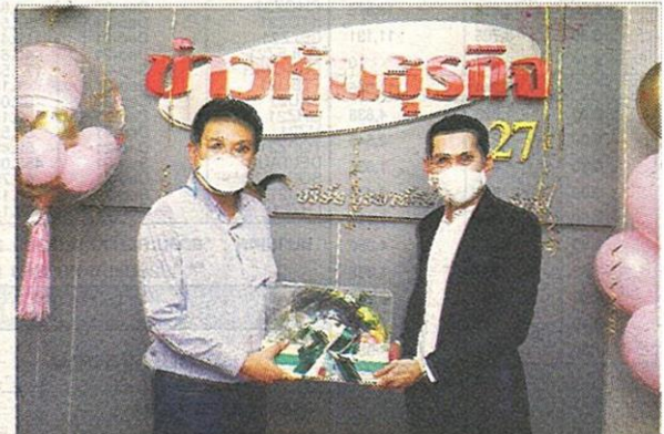
บริษัท ที.เอ.ซี. คอนซูเมอร์ จำกัด (มหาชน) หรือ TACC