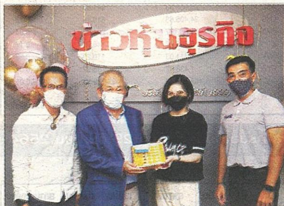
บริษัท รัมดี พลัส จำกัด