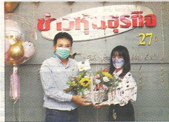
บริษัท เอควิ เอสเตท จำกัด (มหาชน) หรือ AQ

หัวข้อข่าว: ร่วมแสดงความยินดีข่าวหุ้นธุรกิจ ก้าวสู่ปีที่ 28