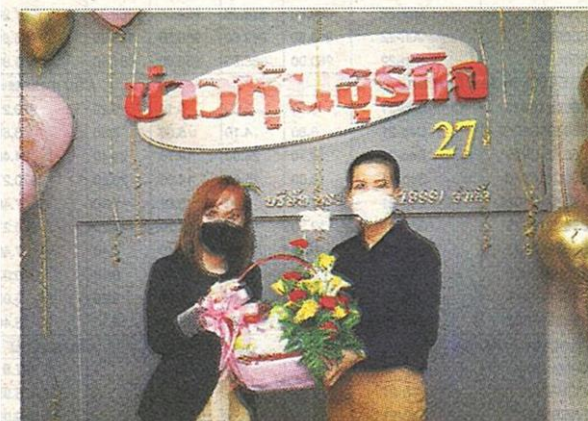
บริษัท อินฟราเซท จำกัด (มหาชน) หรือ INSET