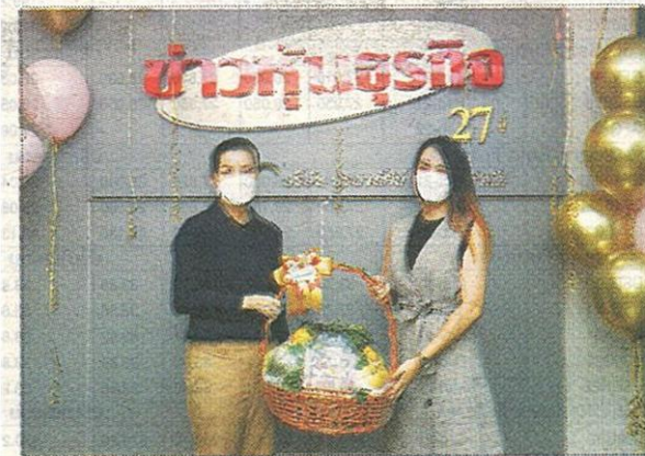
บริษัท สตาร์ค คอร์ปอเรชั่น จำกัด (มหาชน) หรือ STARK