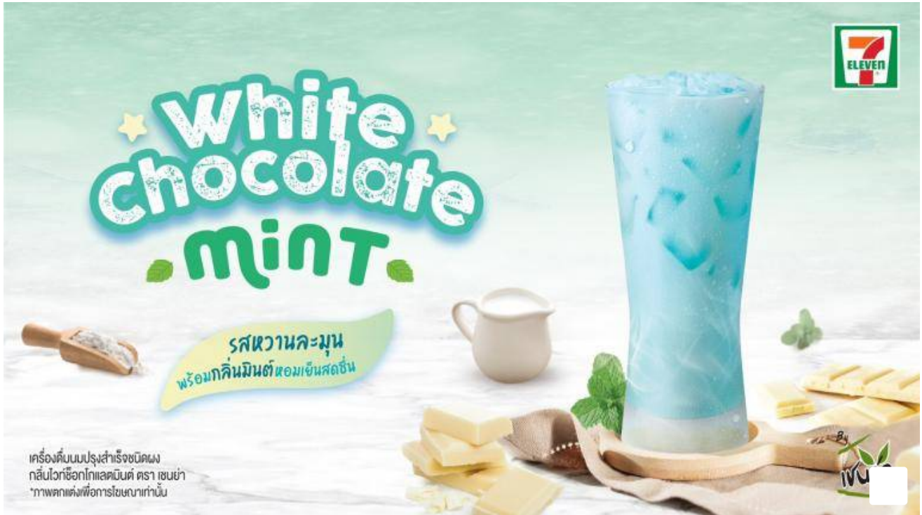
โฆษณา - อ่านบทความต่อด้านล่าง

"ท่ามกลางสถานการณ์วิกฤติการแพร่ระบาดของโรคโควิด-19 การมีเครื่องดื่มที่ช่วยเพิ่มความสดชื่นให้กับร่างกาย เปรียบเสมือนการชาร์จพลังงานให้รู้สึกกระปรี้กระเปร่า ซึ่งเครื่องดื่มดังกล่าวจะใช้นมผงจากประเทศฝรั่งเศส ซึ่งเป็นแหล่งผลิตนม โดยมีรสชาติสัมผัสของนมเหมือนดื่มนมสด คาดว่าผลิตภัณฑ์ใหม่ที่จะออกมานี้จะได้รับความสนใจจากผู้บริโภคได้เป็นอย่างดี"