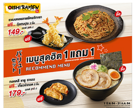
( https://www.oishifood.com/restaurant/oishi-ramen )