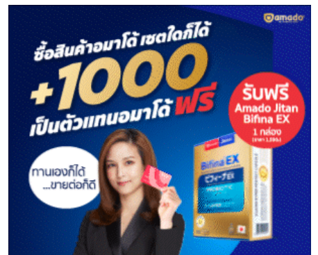
( https://bit.ly/2A5M5Vb )