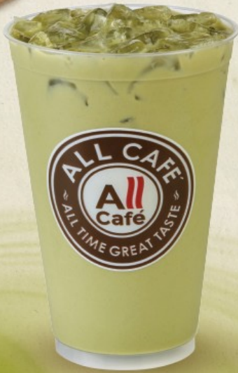
ชาเขียวมัทฉะเย็น 16 oz.