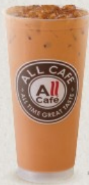
ชานมเย็น