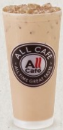
ชานมไต้หวัน