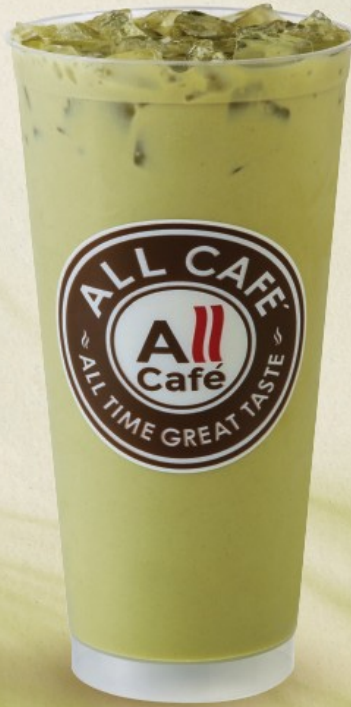
ชาเขียวมัทฉะเย็น 22 oz.