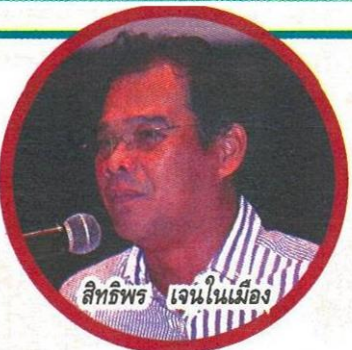
สิทธิพร เจนในเมือง

GULF ราคาเป้าหมายที่ 172.00 บาท มีมุมมองเป็นบวกมากขึ้นหลังประชุมนักวิเคราะห์ 1. บริษัทเปิดเผยการเจรจาโครงการใหม่ Solar Farm ในประเทศ Oman ขนาด 1-2GW 2. มีโอกาสขยาย LNG Terminal ทำเรือมาบตาพุด เฟส 3 เพิ่มเดิมอีก 55% 3. โรงไฟฟ้า LNG ในเวียดนาม 6.0GW มีความคืบหน้ามาก